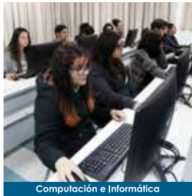
Computación e Informática