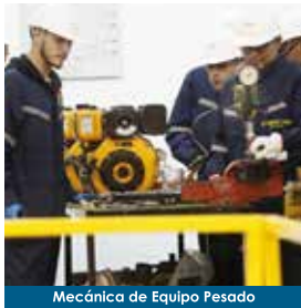
Mecánica de Equipo Pesado