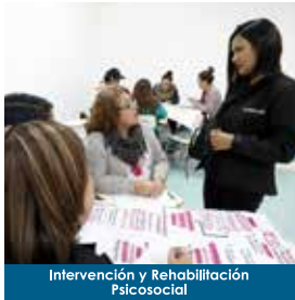
Intervención y Rehabilitación Psicosocial