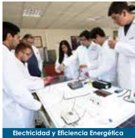
Electricidad y Eficiencia Energética