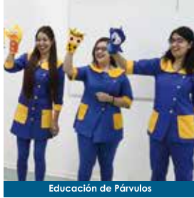
Educación de Párvulos