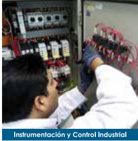
Instrumentación y Control Industrial