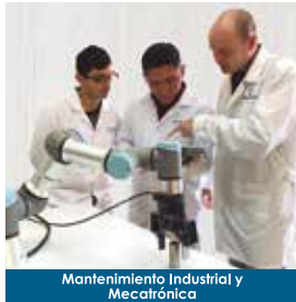
Mantenimiento Industrial y Mecatrónica