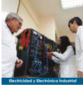
Electricidad y Electrónica Industrial