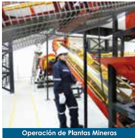
Operación de Plantas Mineras